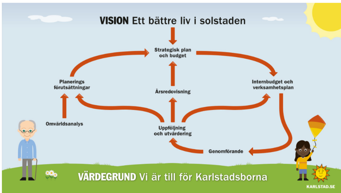
Bild. Kommunens processer för planering och uppföljning i förhållande till styrmodellen

För att utvärdera resultatet av klimatkontraktet används kommunens analysmetod, som är en anpassad och utvecklad variant av Sveriges kommuner och regioners metod för uppföljning och analys. Metoden utgår från att förstå vilket resultat som genereras, vad som orsakat resultatet och vilka åtgärder som behövs för att förändra eller behålla ett resultat.