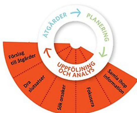
Bild. Metod för utvärdering i fem steg

För att utvärdera resultatet av klimatkontraktet används kommunens analysmetod, som är en anpassad och utvecklad variant av Sveriges kommuner och regioners metod för uppföljning och analys. Metoden utgår från att förstå vilket resultat som genereras, vad som orsakat resultatet och vilka åtgärder som behövs för att förändra eller behålla ett resultat.